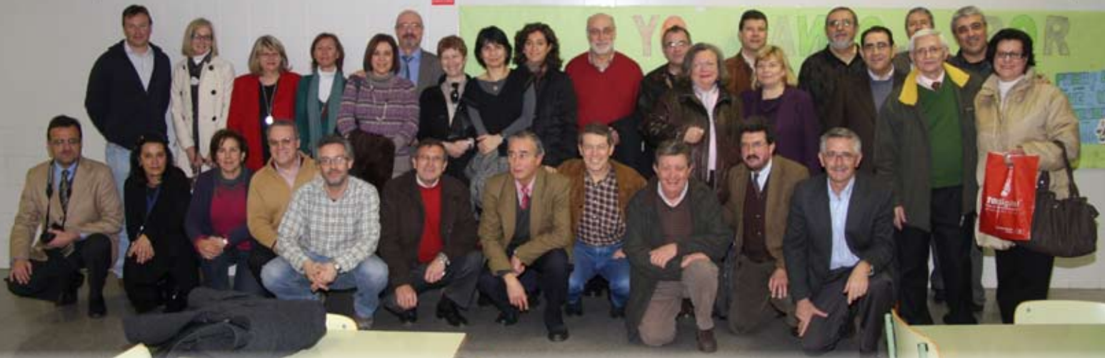
Voluntarios CAM y simpatizantes en la inauguración del Salón de Peluquería en el colegio Nazaret, junto a miembros del cuerpo académico.